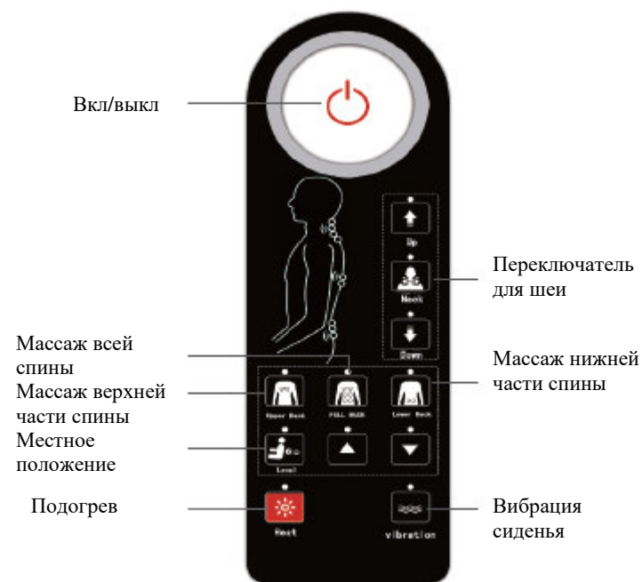
Схема пульта управления

В режиме ожидания или в рабочем режиме устройства нажмите эту кнопку, чтобы включить низкую, среднюю или высокую частоту вибрации и отключить функцию вибрации сиденья, соответствующий индикатор загорится или погаснет (при низкой, средней или высокой частоте вибрации индикатор будет мигать медленно, мигать быстро или не мигать соответственно. По умолчанию установлена низкая частота вибрации).