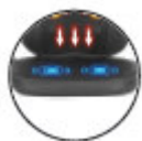
Воздушная подушка на сиденье