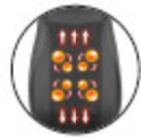
Массаж поясницы с использованием воздушной подушки